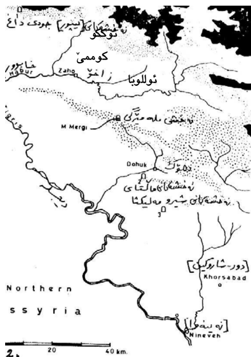
شوینی ولاتهکانی ئوللوبا، کوممی، ئو ککو به پیی ده ستنیشا نکردنی پۆستگه یت

ولاتی ئوللوبا Ulluba یه کێک بوو له ولاتانه ی کوردستانی باکوور که سنووری نیوان ههردوو دهولهتی ئاشورو ئورارتو بوو و نه خشه هه لکه ندر او ه که ی ملا میرگی باسی یه کێک له و جهنگانه ی ئاشور دژ به و ولاته دهکات.